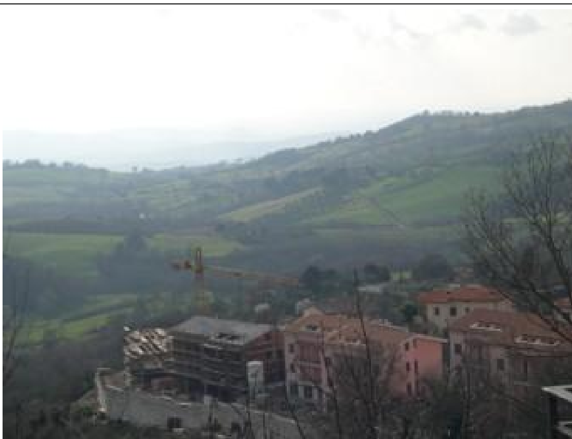
Ville, ultimate e in costruzione, fronte verso il paese di Manciano