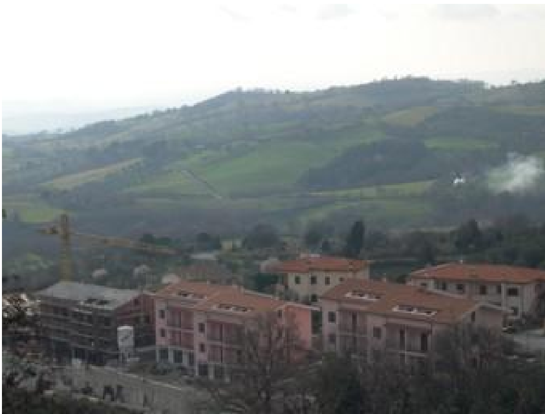
Ville, ultimate e in costruzione, fronte verso il paese di Manciano