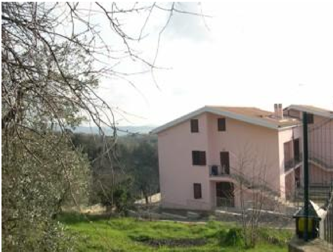
Ville, fronte laterale