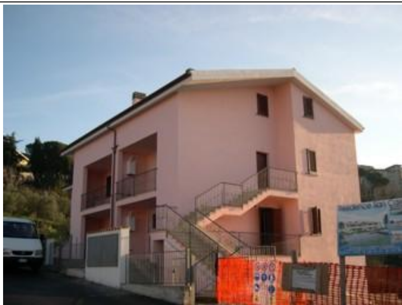
Ville, fronte laterale