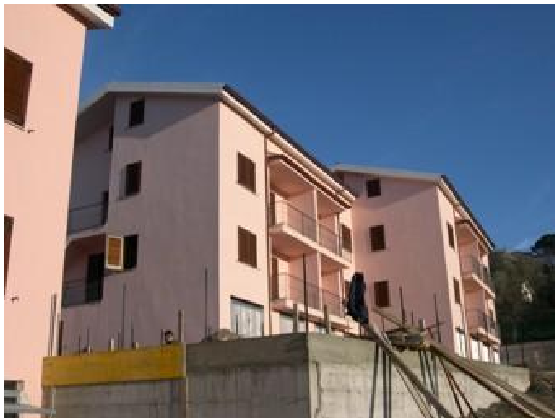
Ville, fronte posteriore