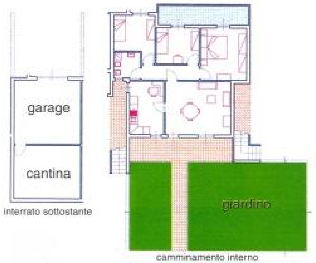
Piano terra blocco D