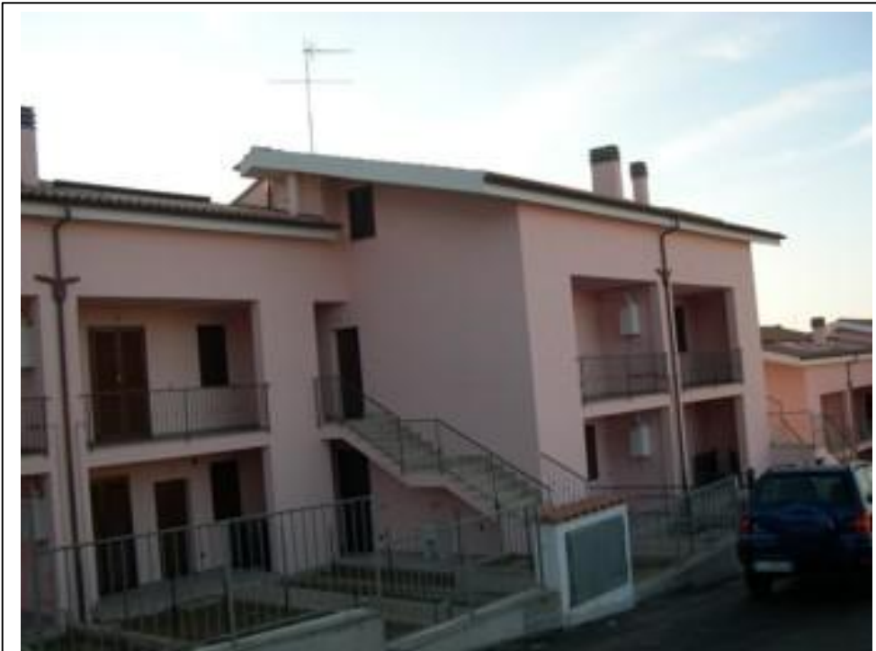
Ville, fronte su strada